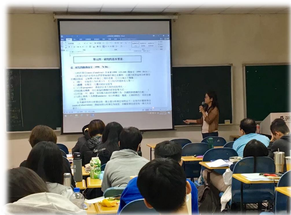
社工師證照輔導情形