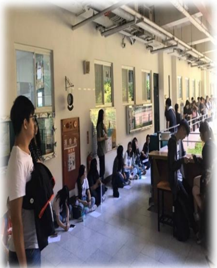
108學年度社工師證照輔導 班報名情形