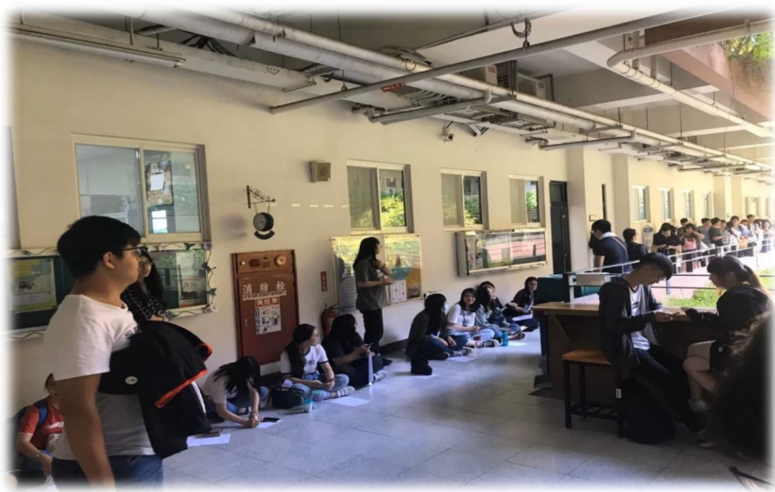
社工師證照輔導報名熱烈